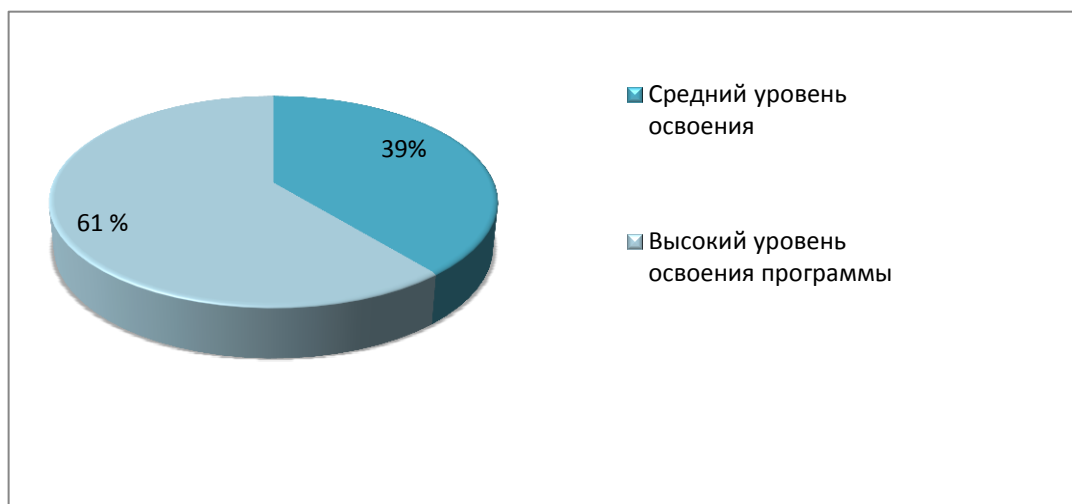
Сводная таблица результатов диагностики уровня удовлетворенности качеством образовательных услуг учащихся и их родителей (по результатам анкетирования 2022 г)