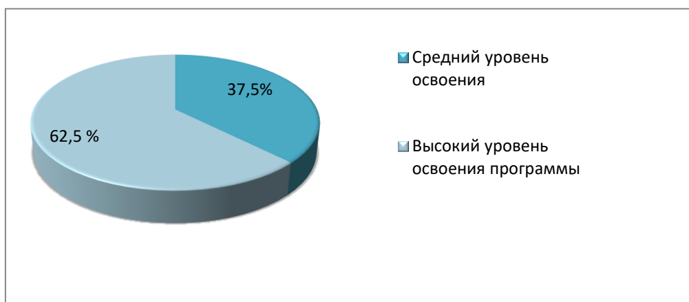
Диаграмма 1. Результаты освоения учащимися ДООП в 2023 (по итогам промежуточного контроля за 2-ое полугодие)

Важным критерием оценки эффективности деятельности творческого объединения и качественных характеристик образовательного процесса, осуществляемого в рамках реализации каждой дополнительной общеобразовательной общеразвивающей программы, являются показатели овладения обучающимися предметных, метапредметных, личностных знаний, умений и навыков. Результаты освоения учащимися программ оценивались различными методами тестирования, результатами «контрольных точек», количеством и качеством участия в конкурсах, акциях, проектах и конференциях районного, регионального и всероссийского уровней. Знания учащихся оценивались по трёхуровневой системе усвоения теоретического и практического материала- высокий, средний, низкий. В ДЭБЦ «Натуралист» был разработан инструментарий – листы текущего и промежуточного контроля уровня обученности, которые заполняются по полугодиям (2 раза в год).