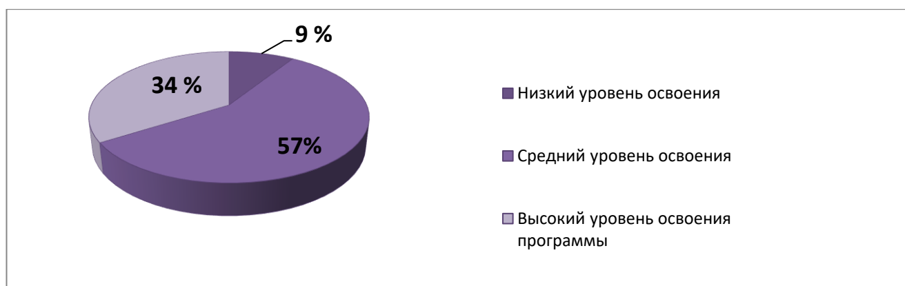
Диаграмма 2. Результаты освоения учащимися ДООП "Приключения в край тайги" в 2024-2025 г. (по итогам текущего контроля за 1-ое полугодие)